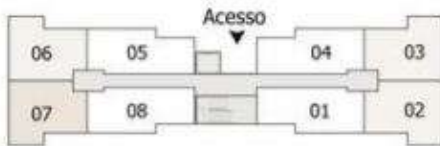
Pavimento Tipo - 2 Dorm. ponta